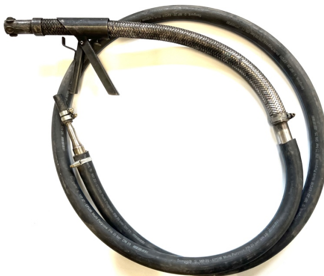
Obr. 2 Odberová sonda dymomeru ACTIA/ATAL AT 605, s priemerom 27 mm a dĺžkou prírodného potrubia 2680 mm, pre výfukové vyústenia s priemerom väčším ako 70 mm